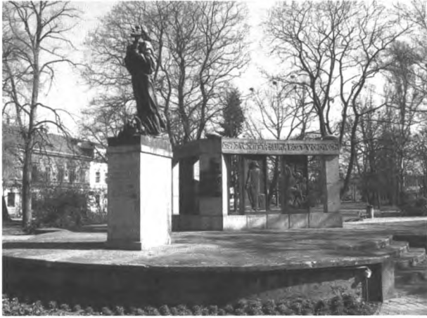
Abb. 1: Hus-Denkmal in Tabor (1926)