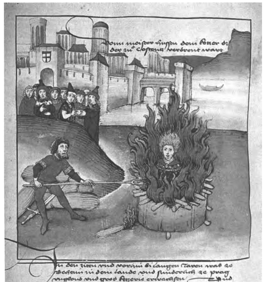
Abb. 3: Verbrennung des Jan Hus, Spiezer Chronik von Diebold Schilling d. Ä. 1484/85

Aus einer Erzählung von Staupitz, der die Einzelheiten wiederum von seinem Vorgänger im Amt Andreas Proles gehört hatte, weiß Luther, dass der in Erfurt begrabene Johannes Zachariae, der Hus verhörte, jenen mit einer gefälschten Bibelstelle in die Enge getrieben habe. 18