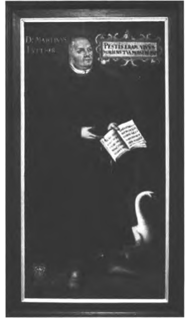
Abb. 5: Luther mit dem Schwan, Jacob Jacobsen, Öl auf Leinwand 1603

Das trifft in besonderem Maße auf die Niederlande zu, wo sich die Darstellungen des Schwans als Symbol der Lutheraner in vielfältiger Weise finden. 36