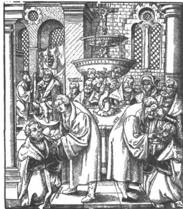
Abb. 7: Luther und Hus teilen das Abendmahl aus, Cranach-Umkreis, Holzschnitt um 1570

Eine mehr als eigenwillige Verwendung findet das Bildnis von Hus in den Riesenholzschnitten des späten 16. Jahrhunderts. Von elf Stöcken gedruckt, sind lebensgroße Porträts Martin Luthers aus der Werkstatt des jüngeren Cranach überliefert. Dazu gehört als Pendant Melanchthon (Abb. 8a). Dessen Kopf allerdings ist einigen Grafiken durch den von Hus ersetzt (Abb. 8b).