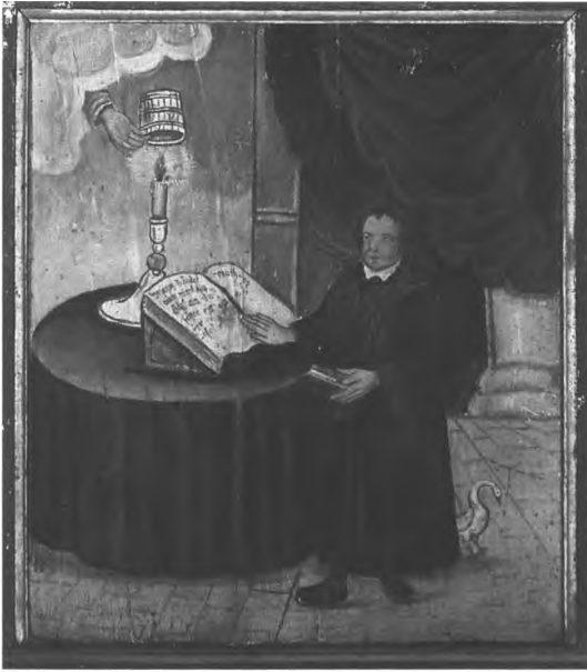
Abb. 6: Luther mit dem Schwan, Hans Stiegler, Öl auf Holz 18. Jahrhundert

Offensichtlich erzeugte die konfessionelle Gemengelage eine besondere Kreativität, was die Nutzung des Schwans auch in der Ausstattung der Kirchen und in liturgischem Gerät anlangt.