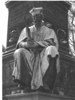
Abb. 10: Lutherdenkmal in Worms, a) Fotografie von 1902, b) Ausschnitt: Jan Hus.

Bis heute lebendig ist der Schwan als Symbol des Luthertums, wenn auch regional begrenzt, in einer ganz anderen Funktion, nämlich als Abschluss von Kirchtürmen und als Wetterfahne. Vor allem im konfessionell gemischten Ostfriesland mit seiner traditionell starken reformierten Tradition, findet er sich als Turmbekrönung auf lutherischen Kirchen. Reformierte Kirchen dagegen lassen sich an einem Schiff erkennen, katholische oft an einem Hahn. Auch hier liegt der zeitliche Schwerpunkt auf dem 17. und 18. Jahrhundert, allerdings wurde er bei Neubauten noch im späten 20. Jahrhundert verwendet. Für den genannten Raum und das Oldenburger Land sind mindestens 86 solcher Kirchenschwäne nachweisbar; außerhalb dieses Kernraumes finden