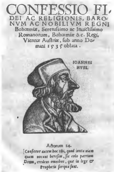
Abb. 2: Glaubensbekenntnis des böhmischen Adels, Wittenberg 1538

Allerdings sind zwei Einschränkungen zu machen: Das Bekenntnis erreichte im Königreich Böhmen nie die gleiche politische Anerkennung wie die Confessio Augustana im Reich. Und den Übergang der