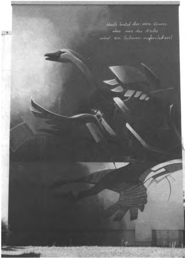
Abb. 12: Luther mit dem Schwan, Guido Zimmermann 2015

Zusammenfassend wird man sagen können, dass Jan Hus, wenn auch indirekt und mittelbar, einen erheblichen Beitrag zur konfessionellen Identität des deutschen Luthertums beigetragen hat.