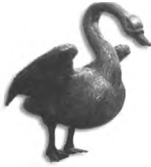
Abb. 9: Figur eines Schwans, Holz mit Silber belegt, um 1600

Mit dem Aufkommen des Historismus um die Mitte des 19. Jahrhunderts bevorzugte man statt allegorischer Darstellungen realistische oder was man dafür hielt. Ein herausragendes Beispiel ist das Wormser Lutherdenkmal von Ernst Rietschel 1863 (Abb. 10a und b).