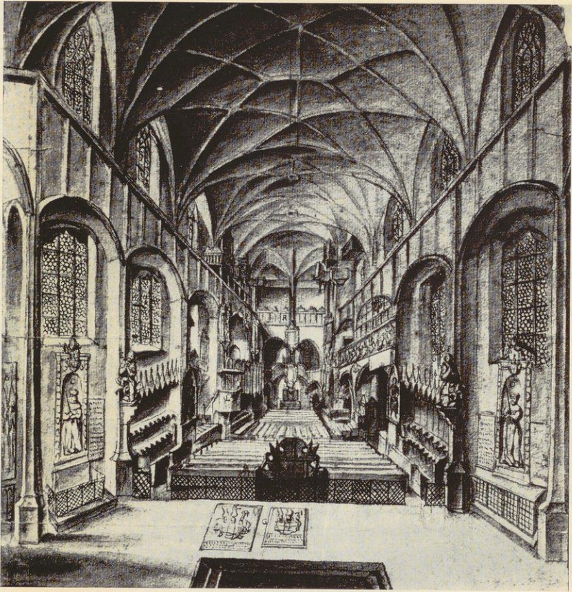
Inneres der Schloßkirche in Wittenberg um 1730 Zeichnung von M. A. Siebenhaar