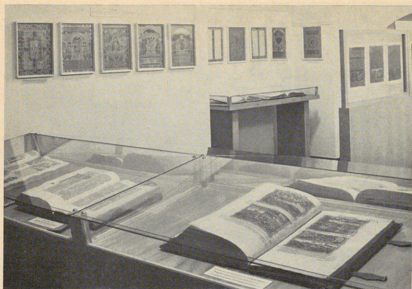
Lutherhalle. Raum der Bibelillustration und Raum der Cranach-Altäre.