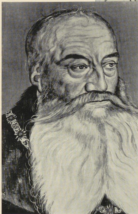
Abb. 2 Georg der Bärtige Deckfarbenblatt von Lucas Cranach d. Ä. Dessau-Landesbibliothek