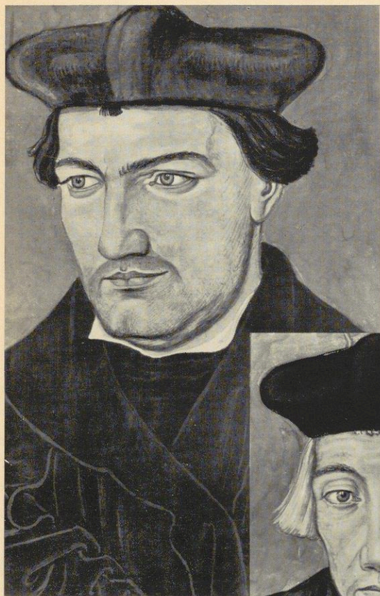
Abb. 3 Georg von Anhalt - Cranach Dessau-Georgsbibliothek