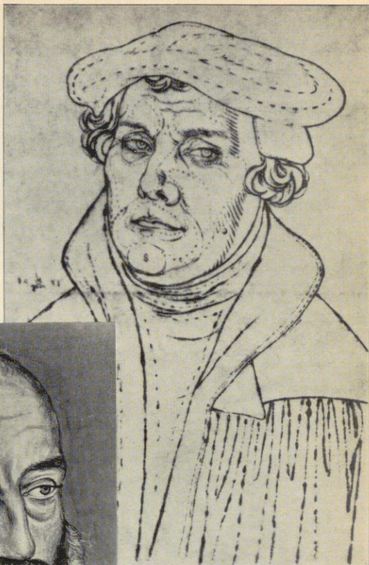
Abb. 1 Lutherbild Durchzeichenblatt zur Vervielfältigung in der Cranach-Werkstatt