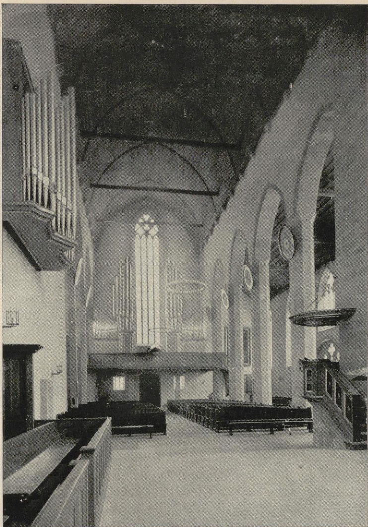
Die erneuerte Augustinerkirche zu Erfurt: Blick zur Orgelempore.