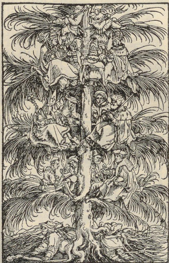
Abb.: 4 Die Stände. Holzschnitt von Hans Weiditz aus der Propyläen Weltgeschichte Bd. V, Propyläen-Verlag

schon im Gipfel der Papst, der Kaiser und die Fürstlichkeiten; über allen diesen Ständen aber der Bauer, in der Krone des Baumes thronend, als höchster und wichtigster Vertreter der Menschheit. In selten klarer Form stellt Weiditz gerade den Bauersmann als den wichtigsten Vertreter aller Stände heraus, auf den sich alle anderen, selbst auch die Kirche gründen. Ein Beweis für die fast mystische Verherrlichung des Bauern, deren er sich in den Sturmjahren der Reformation erfreute.