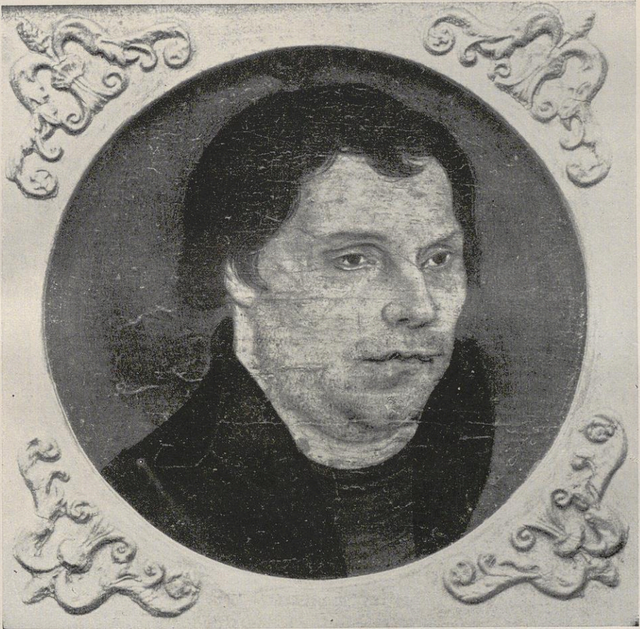
Abbildung 4 Luther als Heuermähter