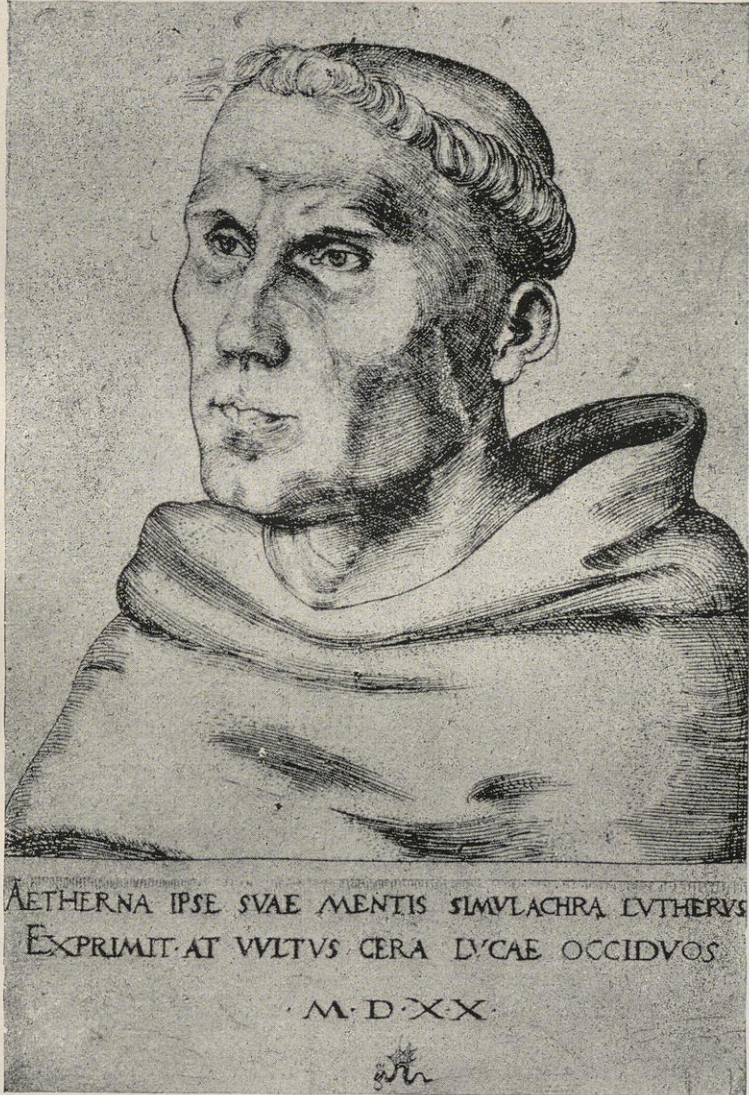
Abbildung 1 Luther als Mönch 1520