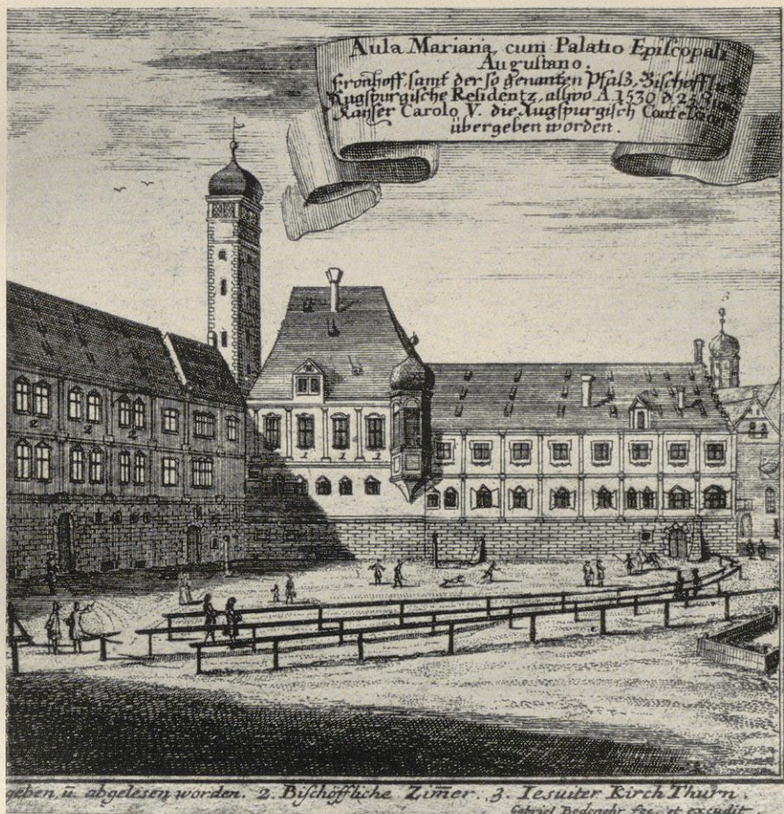
I. Bischöfliche Pfalz in Augsburg. Die Zahl I bezeichet den Saal (mit Erker), in dem die Verlesung stattfand; Kupferstich aus dem Jahre 1730