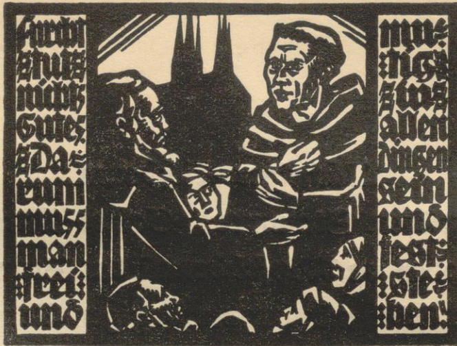
Begrüßung Luthers in Erfurt