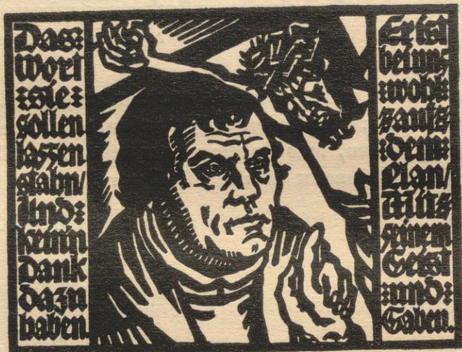
Luther als Reformator

ling von dem „Ehrentag des deutschen Gewissens“ sprach, von der Schlussfeier am Lutherdenkmal, doch jenes „Wir wollen“ möge als gewaltiger Klang am Schlusse dieses Berichtes stehen und im Herzen manches Lesers, der nicht dabei war, nachhallen zu gleichem Schwur.