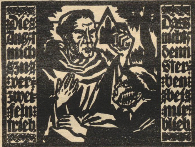
Luther in Unterredung mit Staufitz