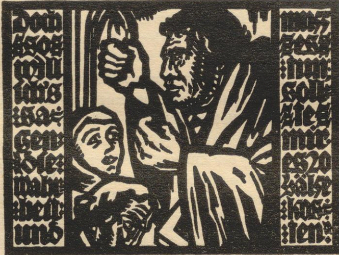
Luther in der Augustiner-Kirche predigend