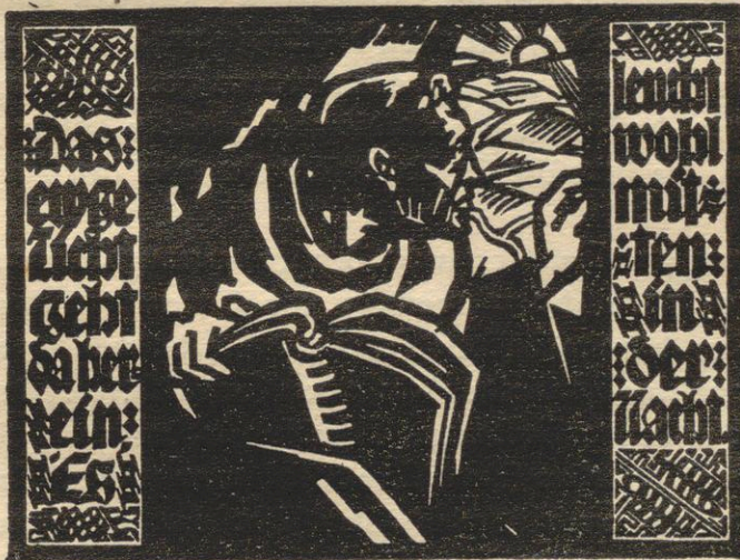
Luther bei der Bibelübersetzung

am Elstertore am 10. Dezember 1920 gemahnt. Wir sind mit ihm gezogen, und haben es noch einmal mit durchlebt, wie er dahingezogen ist in unbeirrbarer, gelassener Zuversicht von Bann zu Bann, von Bann zur Acht, von der Acht zum Patmos auf der Burg. Damals umgeben und begrüßt vom brausenden Jubel seiner Deutschen, die in ihm den Helden und Herzog seines Volkes, den Engel und Evangelisten Gottes grüßten. Heuer bei unseren Feiern auch manch lauter Jubel und brausende Zustimmung von Tausenden, aber was uns mehr dünken will: bei vielen ein starkes Gefühl Luther wieder erlebt zu haben, den Herzschlag seiner frommen Heldenhaftigkeit gespürt zu haben, gleichsam in ein inneres Treuverhältnis zu ihm als dem Führer auch für die Gegenwart getreten zu sein. Der Luther geht durch die Lande! Möge das der Gewinn dieser großen Feiern sein, auf daß mehr Kenntnis von Luther, mehr Verständnis für Luther, mehr Bekenntnis zu Luther im fünften Säkulum seit jenen Großtagen 1520—21 in deutschen Landen und in aller Welt lebendig sei.